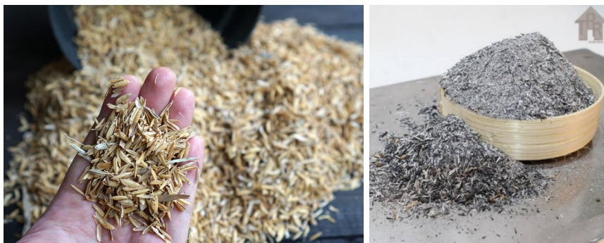
Gambar 2. Sekam Padi dan Abu Sekam padi

Menurut KBBI (Kamus Besar Bahasa Indonesia), sekam adalah kulit padi (sesudah padi ditumbuk). Sekam merupakan bagian biji-bijian (sereal) yang berupa daun kering, bersisik, dan tidak dapat dimakan, yang melindungi bagian dalam (endosperm) dan embrio). Sekam dapat ditemukan di sebagian besar rumput(Poaceae), meskipun pada beberapa tanaman, varietas sereal tanpa kulit juga dapat ditemukan (misalnya jagung dan gandum).