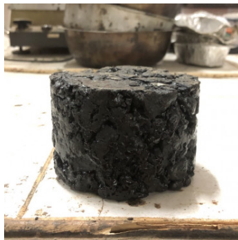
Gambar 1. Sampel Campuran Perkerasan AC-WC

Perkerasan lentur adalah perkerasan jalan yang menggunakan material aspal. Perkerasan ini umumnya digunakan pada konstruksi jalan raya perkotaan yang lalu lintas kendaraannya padat. Material pekerasan ini terdiri dari material pasir, batu dan aspal (Andi Ibrahim Yunus, dkk., 114: 2024).