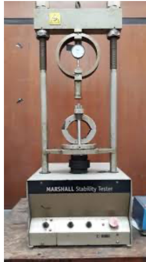
Gambar 3. Alat Uji Aspal/ Marshall Test

Pengujian Marshall dilakukan untuk mengetahui nilai stabilitas dan kelelahan (flow), serta analisa kepadatan dan pori dari campuran padat yang terbentuk.