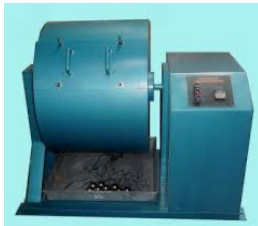
Gambar 4. Alat Uji Cantabro

Cantabro adalah pengujian yang bertujuan untuk menganalisis ketahanan campuran aspal terhadap disintegrasi dengan menggunakan mesin Los Angeles. (Djoko Sarwono, F. Pungky Pramesti, Hegar Lasardi Kurniawan, 2018).