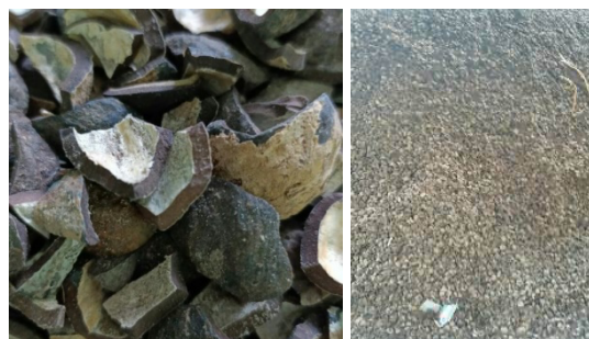
Gambar 2. Cangkang Kemiri dan Abu Cangkang Kemiri

Menurut KBBI (Kamus Besar Bahasa Indonesia), cangkang adalah kulit keras yang menutupi badan.