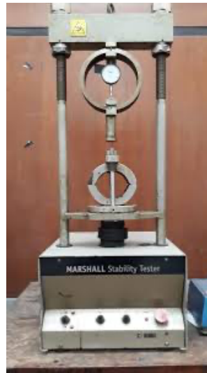
Gambar 4. Alat Uji Aspal/ Marshall Test

optimum. Pengujian ini menghasilkan sejumlah data Marshall properties dan terdiri dari stabilitas, flow , MQ, VIM, VMA, dan VFB.