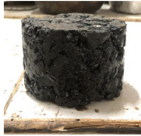
Gambar 1. Sampel Campuran Perkerasan Aspal

padat. Material pekerasan ini terdiri dari material pasir, batu dan aspal (Andi Ibrahim Yunus, dkk., 114: 2024).